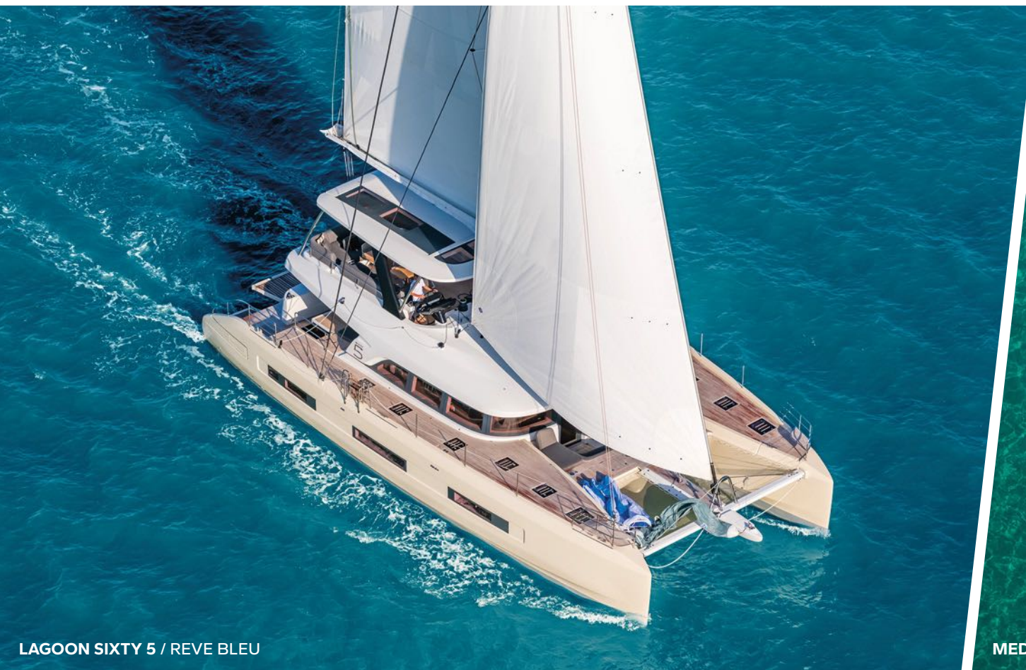
LAGOON SIXTY 5 / REVE BLEU