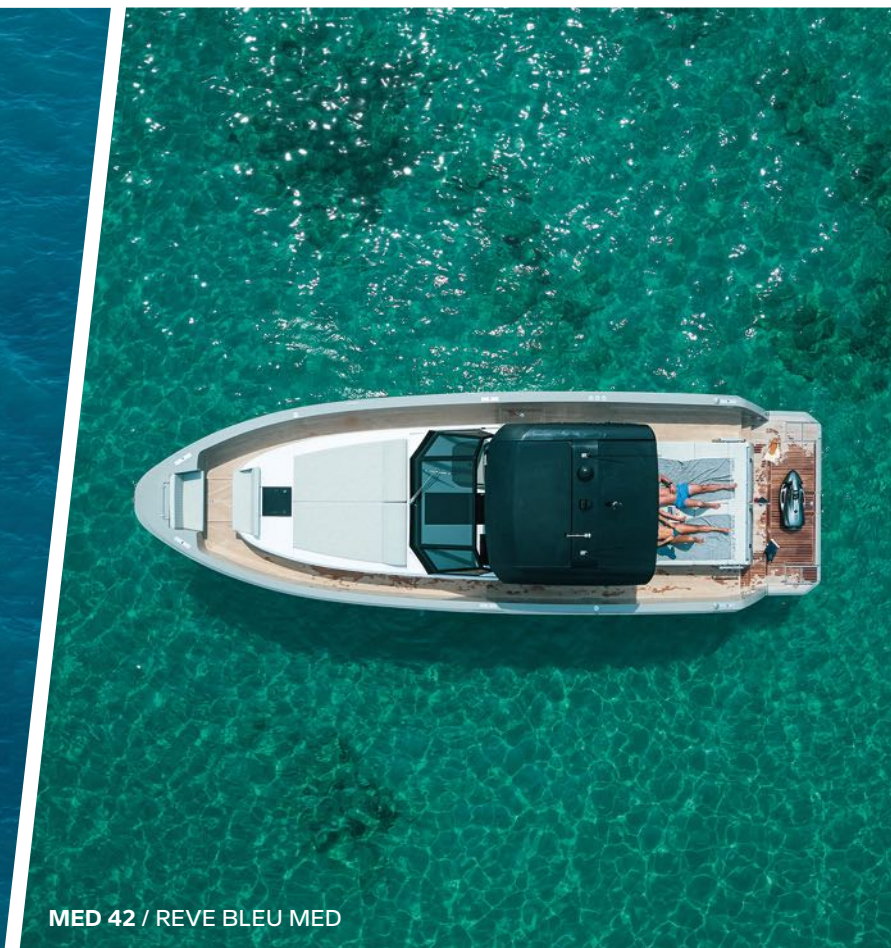
MED 42 / REVE BLEU MED